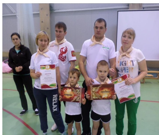
Участие в районном соревновании «Мама, папа, я – спортивная семья».